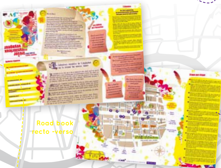
Road book recto-verso